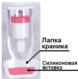
Рис.1. Краник горячей воды

Наливая горячую воду в чашку из краника-пуш, всегда нажимайте чашкой на часть лапки краника с силиконовой вставкой! Нажатие на пластиковый край лапки краника может привести к соскальзыванию чашки с лапки краника и попаданию на Вас каплей горячей воды. Никогда не нажимайте рукой на лапку краника горячей воды!